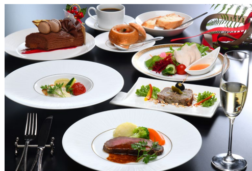
創作クリスマスディナー