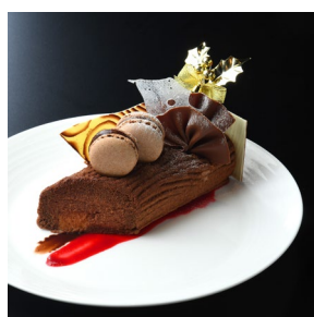
ブッシュドノエル (2名様)